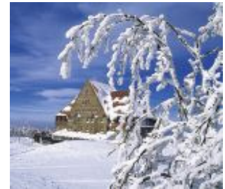
Relaxhotel Sachsenbaude Oberwiesenthal 037348-1390

Unseren geschätzten Gästen, unseren Geschäftspartnern und Freunden wünschen wir ein Frohes Fest und einen guten Start in das neue Jahr.