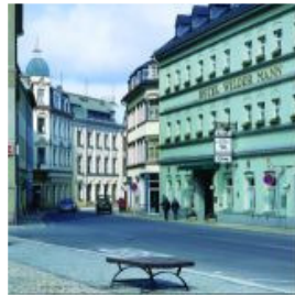
Hotel Wilder Mann Annaberg-Buchholz 03733-1440