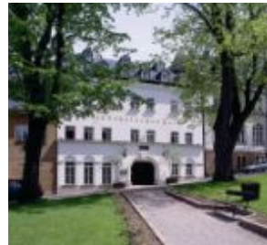
Hotel Sächsischer Hof Scheibenberg 037349-79046