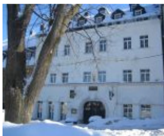
Hotel Sächsischer Hof Scheibenberg 037349-79046