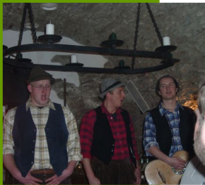
„De Bossen“ im Kartoffelkeller

Es wird zur Tradition: unser Bockbierfest mit freundlicher Unterstützung der Weltenburger Brauerei im urigen Kartoffelkeller Annaberg , mit spitzen Live-Musik und köstlichem Asam-Bock. In diesem Jahr Ende Februar.