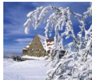
Relaxhotel Sachsenbaude Oberwiesenthal 037348-1390

Sehr geehrte Gäste. Wir freuen uns über Ihr weiteres Interesse an unseren Häusern im oberen Erzgebirge, den Angeboten - von denen Sie so aktuell wie möglich erfahren sollen und den Neuigkeiten in und um unsere gastfreundlichen Hotels.