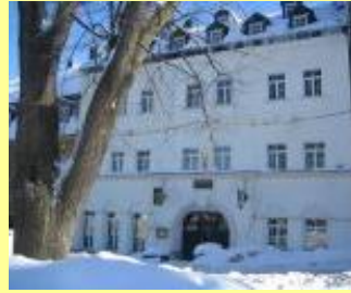
Hotel Sächsischer Hof Scheibenberg 037349-13480