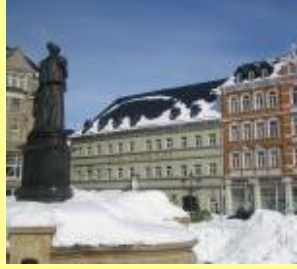
Hotel Wilder Mann Annaberg-Buchholz 03733-1440