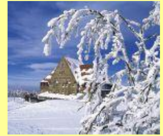
Relaxhotel Sachsenbaude Oberwiesenthal 037348-1390